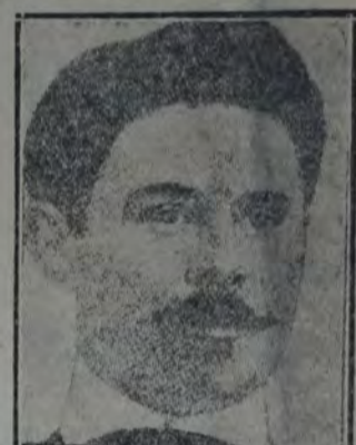
El capitán francés procesado por "traición a la patria".